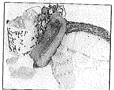
Die warme Vorspeise: Zander und Eglifilets aus der Schweiz mit einem Kräuterkartoffelpüree.